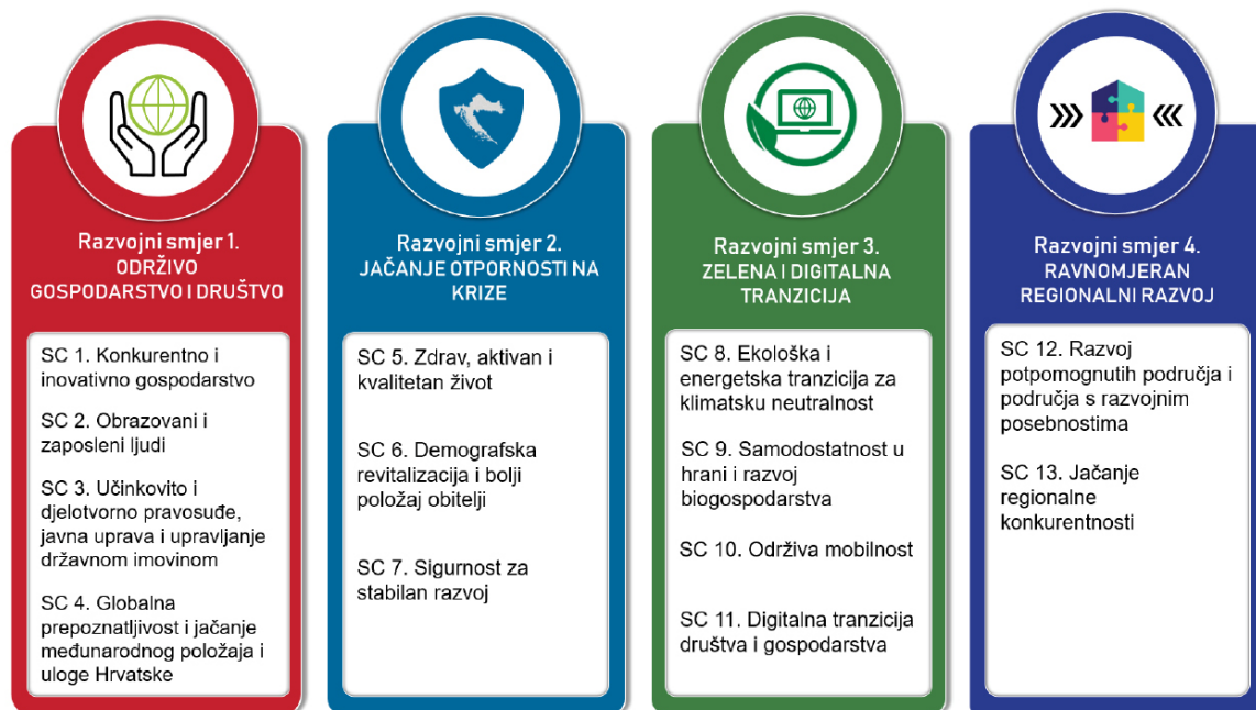
Slika 1. Strateški okvir

Strateški okvir NRS 2030., kao krovni nacionalni strateški akt na koji se potom veže i strateški smjer razvoja na regionalnoj i lokalnoj razini sastoji se od sljedećih razvojnih smjerova i strateških ciljeva (dalje: SC):